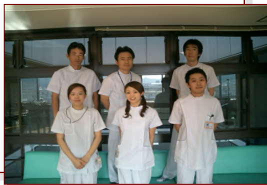
<リハビリテーション室スタッフ>

そのような状態で食事を続けると、嚥下性肺炎の危険性が高くなります。評価、食事場面の観察、他の専門職・病棟との情報交換を行い安全な食べ方や適切な食事内容について検討します。また、のどや口の運動訓練、飲み込みの訓練などを行い摂食・嚥下機能の向上をはかっています。