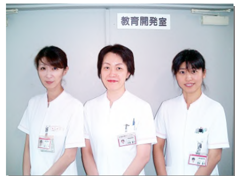
-教育開発室スタッフ-