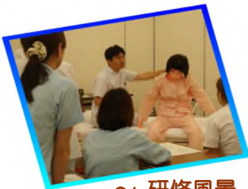
～ 研修風景 ～

さらに 12 月からは金沢大学医薬保健学域健康増進科学センターとの連携事業をとおり、地域連携の中に活かす新たなチャレンジも試みています。何事にも常に積極的に取り組む姿勢を持ち続けていきたいと思っています。