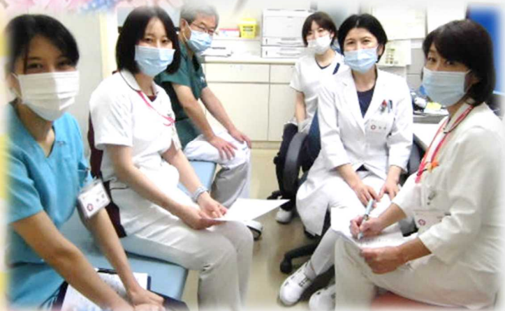
緩和ケアチームカンファレンス